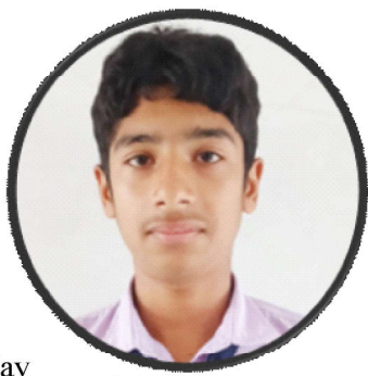
उत्सव की सापकोटा

Enjoy! Just enjoy your life Enjoy in every happiness today Enjoy the dark tonight Enjoy just enjoy the life It is possible when we are alive Enjoy and ready to joy the moments that comes on the way