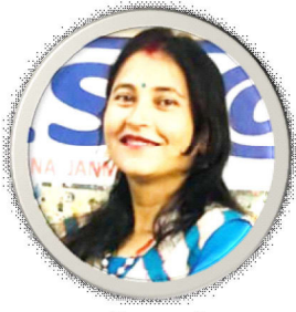
उत्सव की सापकोटा

आज राति सपनीमा आयौ तिमी वर्षौको भल्को मेटायौ तिमीले दुवै हुकडुकीलाई स्फुरण गराई अतृप्त भोगको प्यासमा डुबाई विलायौ किन ?