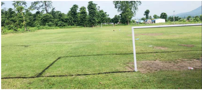
प्रथम संस्करणको जोन स्मृति फुटबल प्रतियोगिता हुने मनहरीको चौरको तस्वीर।