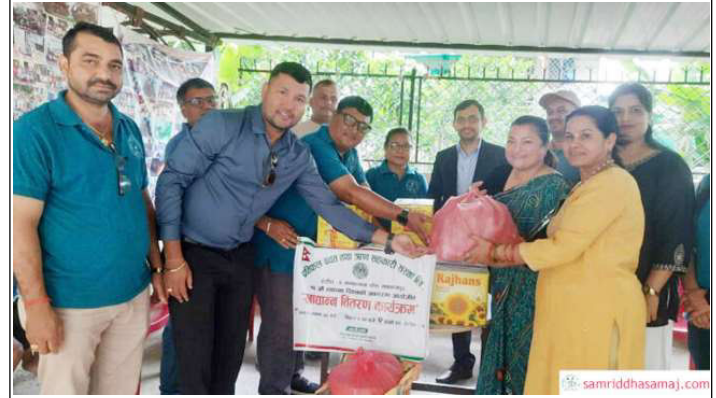
खाद्यान्न सामग्री हस्तान्तरण गरिँदै ।