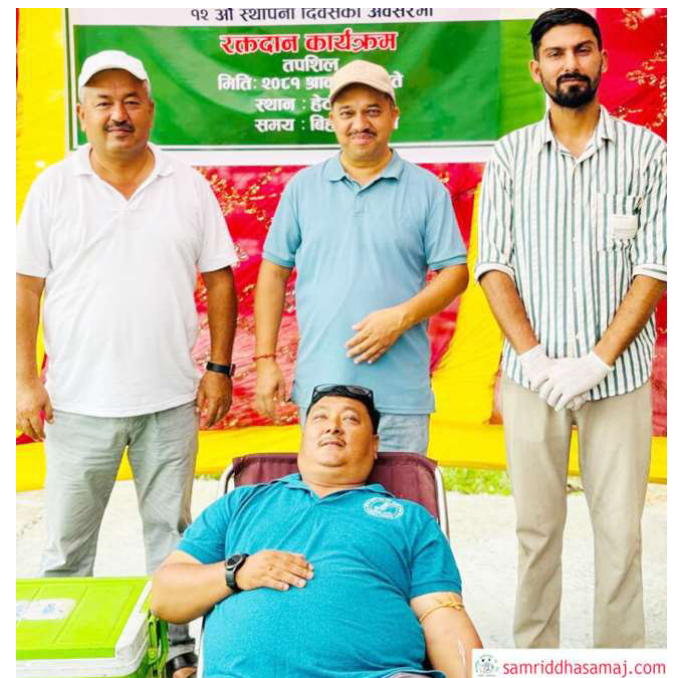
रक्तदान गर्दै रक्तदाता ।