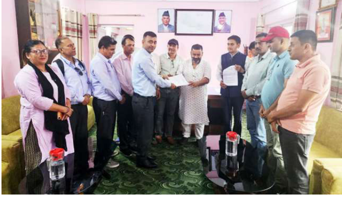
नगर उपप्रमुख बानियाँलाई ध्यानाकर्षणपत्र बुझाउँदै शिक्षक महासंघसहित विभिन्न संगठनका शिक्षक नेताहरु ।