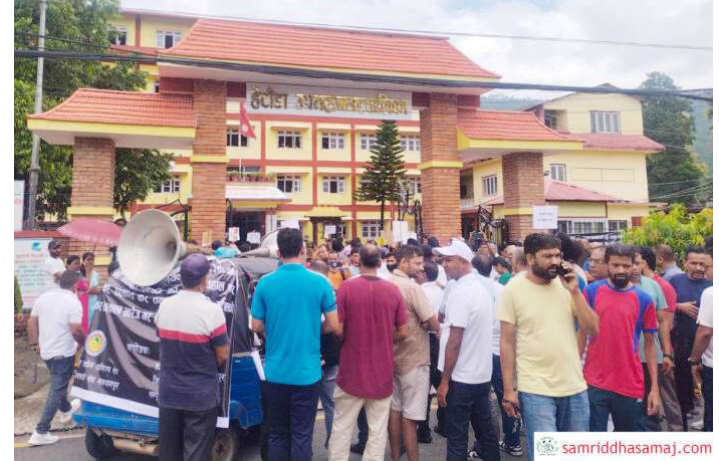
बुधवार हेटौँडा उपमहानगरपालिका अगाडि धर्नामा बसेका व्यवसायीहरु ।