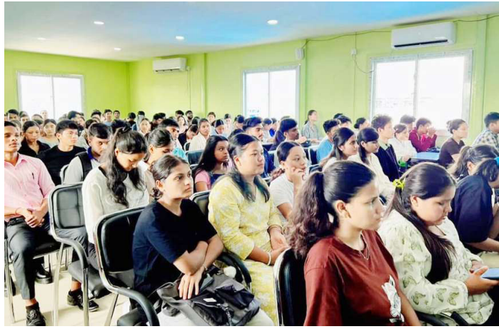
कार्यशालामा सहभागी विद्यार्थीहरू ।