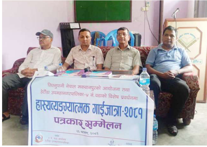
गाईजात्रा प्रहसनवारे जानकारी गराउन आयोजित पत्रकार सम्मेलनमा वडाअध्यक्ष र आयोजक ।