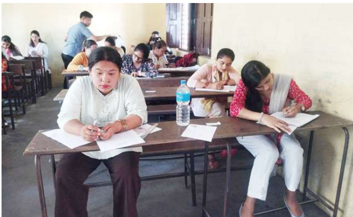
प्रारम्भिक बालविकास कक्षाको सहयोगी कार्यकर्ताका लागि परीक्षामा सहभागी परीक्षार्थीहरू ।