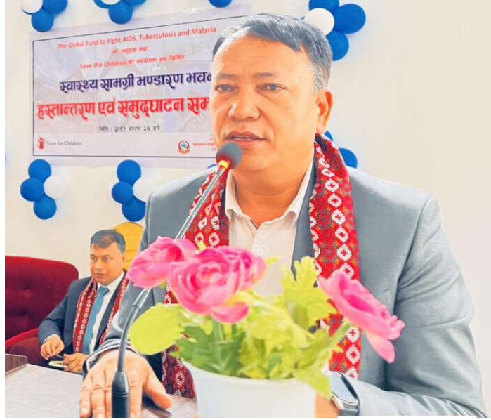
कार्यक्रमलाई सम्बोधन गर्नुहुँदै स्वास्थ्य मन्त्री किरण थापा ।