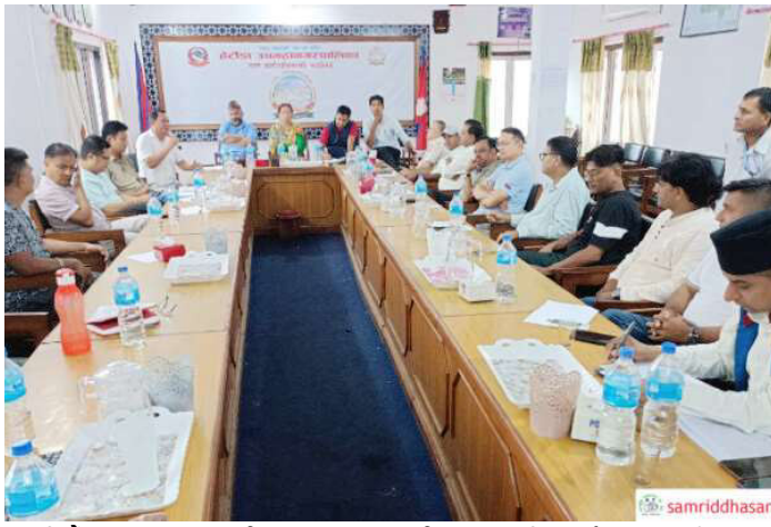
हेटौडा उपमहानगरपालिकामा मंगलबार बिहान भएको वार्तामा सहभागीहरू।