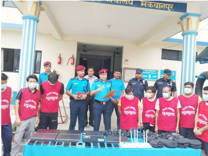
अनलाईनमार्फत ठगी गरेको अभियोगमा पक्राउ परेकाहरूलाई सार्वजनिक गर्दै प्रहरी ।