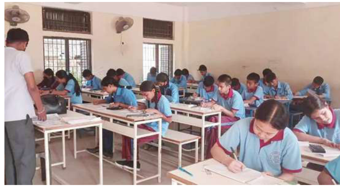
हेटौंडा-४ स्थित आधुनिक राष्ट्रिय माविमा परीक्षा दिँदै विद्यार्थी ।