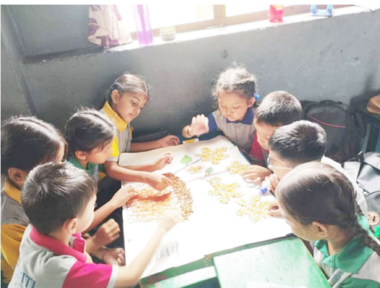
बुक फ्री फ्राइडेअन्तर्गत बालजागृति इंग्लिस सेकेण्डरी स्कूलका विद्यार्थी विविध क्रियाकलापमा सहभागी हुँदै।