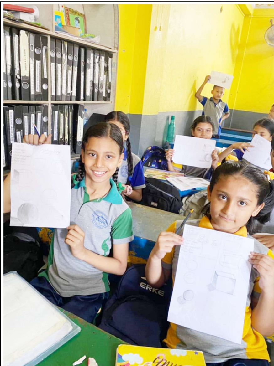
बुक फ्री फ्राइडेअन्तर्गत बालजागृति इंग्लिस सेकेण्डरी स्कूलका विद्यार्थी विविध क्रियाकलापमा सहभागी हुँदै।