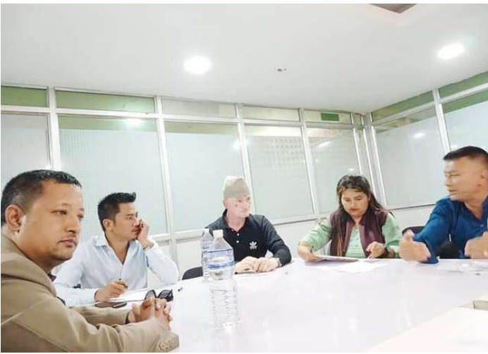
विहिवार राप्रपा संसदीय दलको बैठकमा सहभागीहरू ।