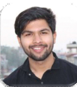
आयुष अधिकारी पोषणविद

शरीरलाई स्वस्थ राख्न चाहिने विभिन्न तत्वमध्ये एक हो भिटामिन । शरीरलाई आवश्यक काबोहाइड्रेट, प्रोटीन, बोसो (चिल्लो पदार्थ), पानी र मिनरल (खनिज) तत्त्व जस्तै भिटामिन पनि एक हो । शरीरलाई स्वस्थ राख्न, रोगप्रतिरोधात्मक क्षमता बढाउन र मस्तिष्कलाई सक्रिय बनाई सकारात्मक सोच र क्षमता बढाउन भिटामिनको भूमिका हुन्छ ।