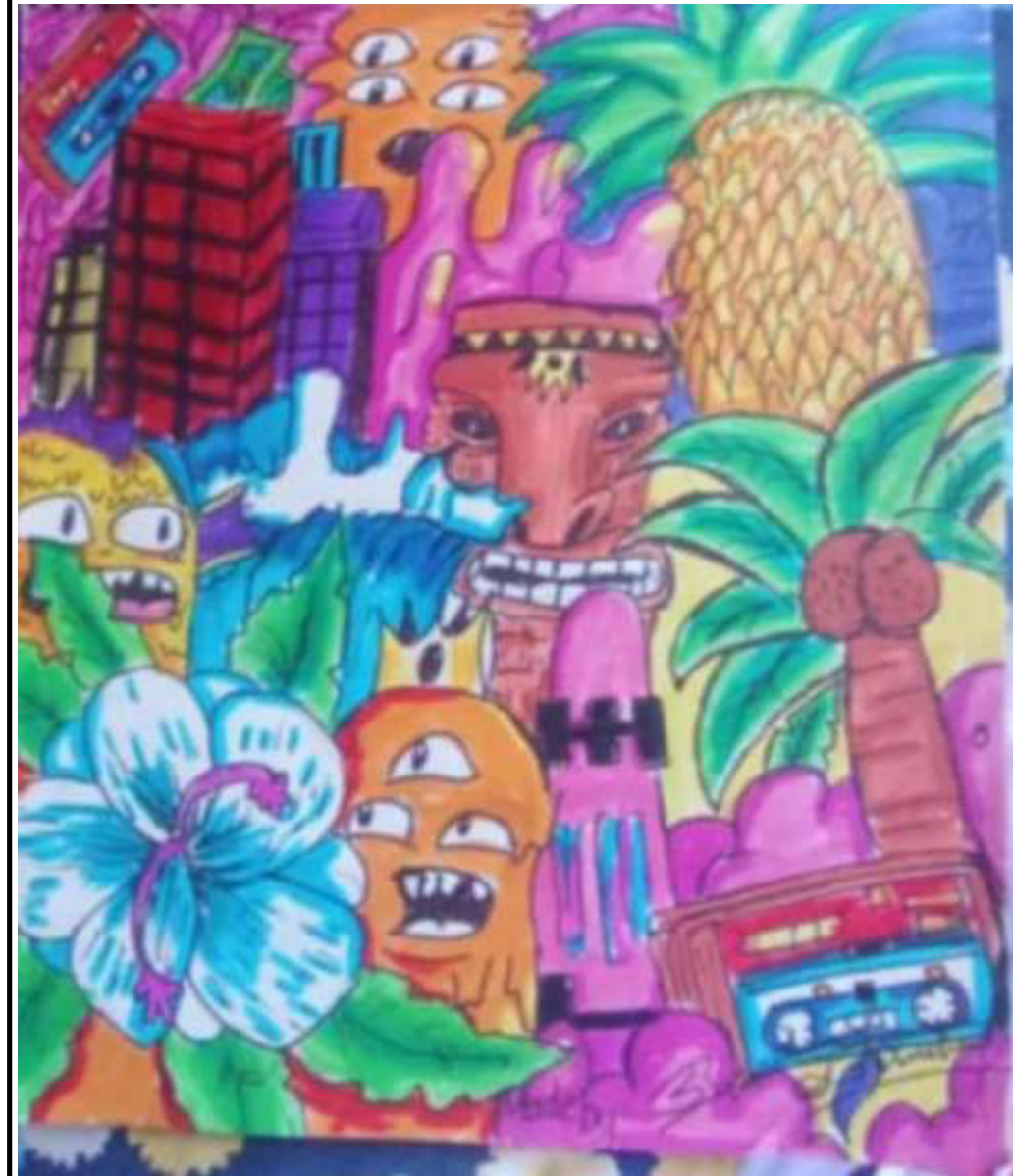
सायुज्य देवकोटा कक्षा-६