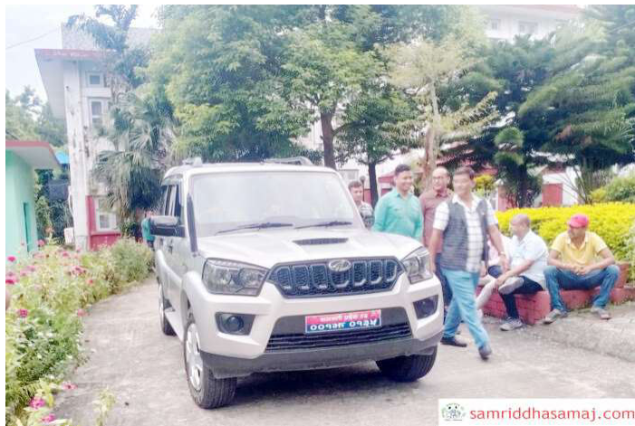
सपथ ग्रहण कार्यक्रम स्थगित भएसँगै मन्त्री नलिई फर्किँदै गाडी ।