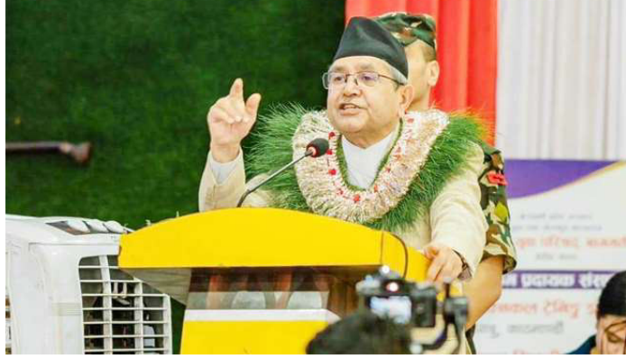
कार्यक्रमलाई सम्बोधन गर्नुहुँदै सभामुख देवराज घिमिरे ।