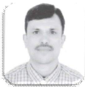
पुनः पदम मण्डारी

'सुशासन, सामाजिक न्याय र समृद्धि' नाराका साथ नेपालको १६ औं पञ्चवर्षीय योजना कार्यान्वयनमा आइसकेको छ । ७.३ प्रतिशतको आर्थिक वृद्धिदरको लक्ष्य रहेको १६ औं पञ्चवर्षीय योजनाले तोकिएको महत्वाकांक्षी लक्ष्य हासिल गर्न आव २०८१-८२ को बजेट तथा कार्यक्रम तय भएको छ । नेपालले आफ्नो अर्थतन्त्रको व्यापक संरचनात्मक रूपान्तरण गर्न आगामी आवको बजेट तथा कार्यक्रम त्यसतर्फ उन्मुख छ कि छैन भन्ने बहसको विषय बनेको छ ।