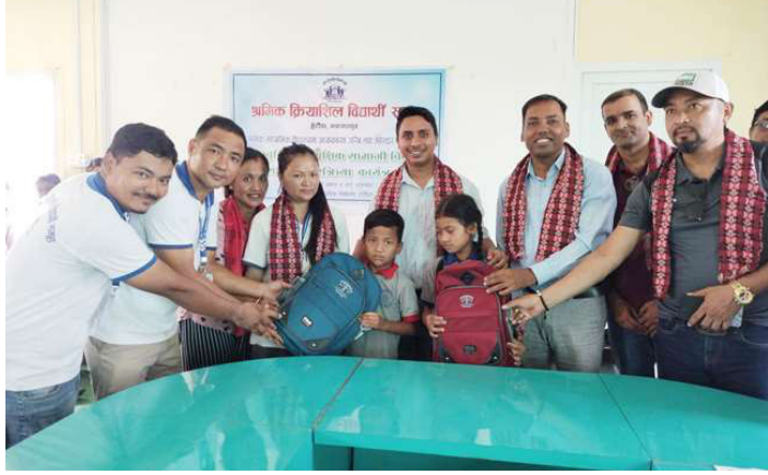
विद्यार्थीलाई शैक्षिक सामग्री सहयोग हस्तान्तरण गरिदै ।