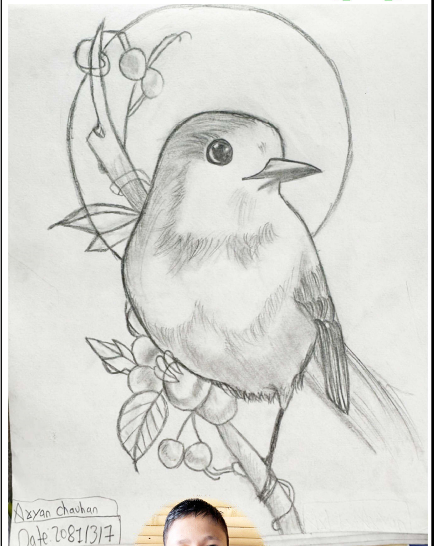
आर्यन चौहान कक्षा-७