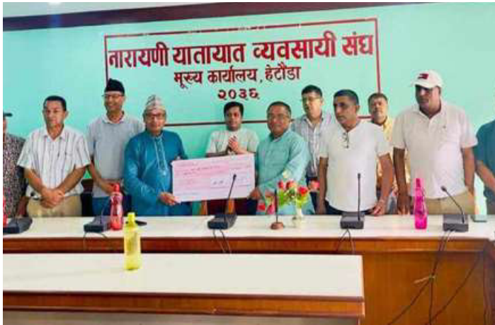
नारायणी यातायात व्यवसायी संघले एक लाख रुपैयाँ हस्तान्तरण गरिँदै ।