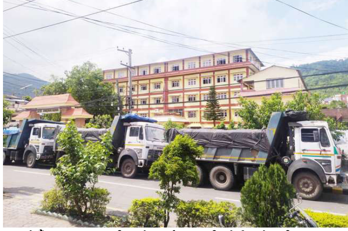
हेटौंडा उपमहानगरपालिकाको कार्यालय अगाडि रोकी राखेका टिपरहरू ।