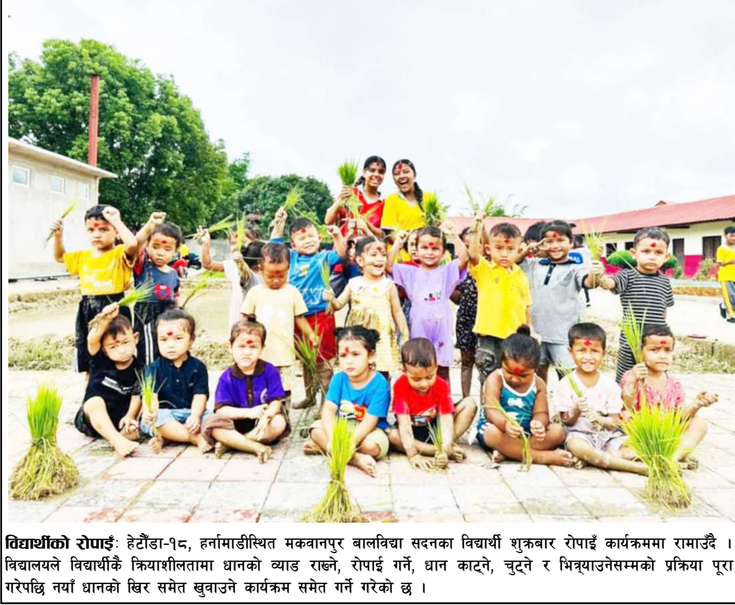
विद्यार्थीको रोपाईं: हेटौडा-१८, हर्नामाडीस्थित मकवानपुर बालविद्या सदनका विद्यार्थी शुक्रबार रोपाईं कार्यक्रममा रामाउँदै । विद्यालयले विद्यार्थीकै क्रियाशीलतामा धानको व्याड राख्ने, रोपाईं गर्ने, धान काट्ने, चुट्ने र भित्र्याउनेसम्मको प्रक्रिया पूरा गरेपछि नयाँ धानको खिर समेत खुवाउने कार्यक्रम समेत गर्ने गरेको छ ।