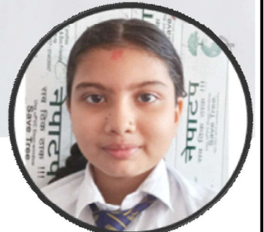
आरूसी काफले कक्षा-५, तारा