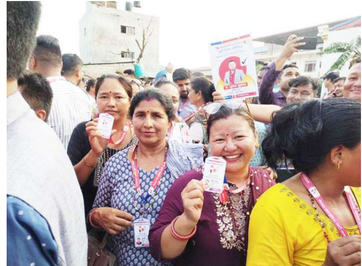
मतदानका लागि लामवद्ध प्रतिनिधिहरू आफ्नो परिचयपत्र देखाउँदै।