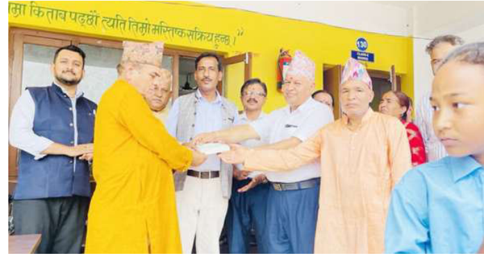
सहयोग रकमको चेक हस्तान्तरण गरिँदै ।