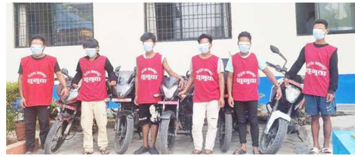
चोरीको मोटरसाइकलसहित पक्राउ परेकाहरूलाई प्रहरीले सार्वजनिक गर्दै ।