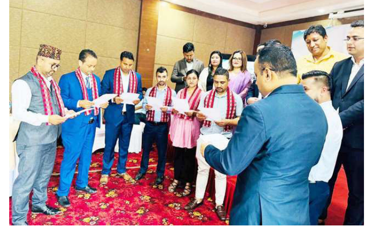
इक्यान मकवानपुर जिल्ला समन्वय समितिका संयोजक र सदस्यलाई सपथ गराउँदै।