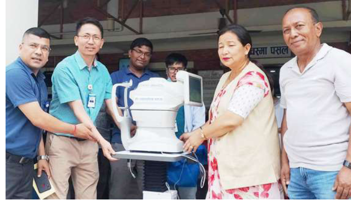
हेटौँडा सामुदायिक आँखा अस्पताललाई उपकरण हस्तान्तरण गरिँदै।