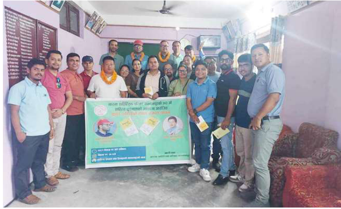
साहित्यिक कार्यक्रमपछि सामूहिक तस्वीर खिचाउँदै ।