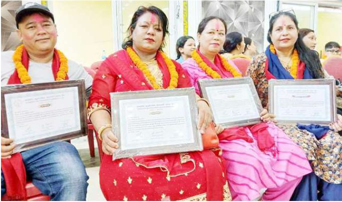
ज्ञानदीप सहकारीद्वारा सम्मानित व्यक्तिहरु ।