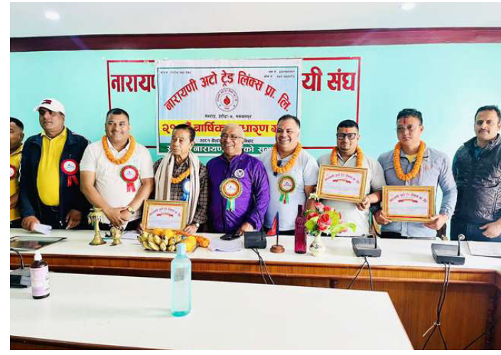
साधारणसभामा सम्मान पछि सामूहिक तस्वीर खिचाउँदै ।