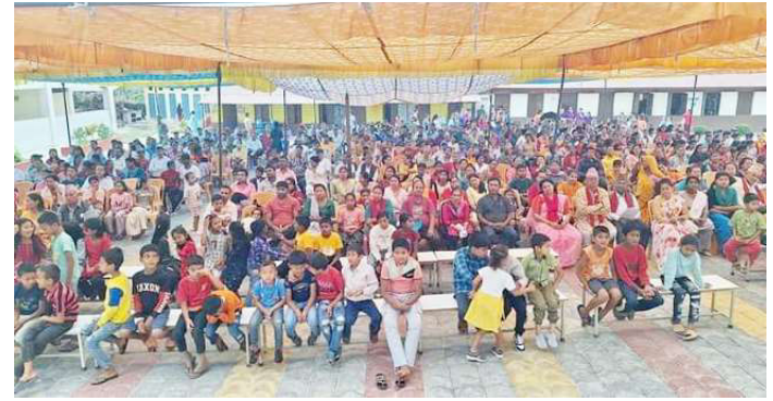
अभिभावक भेलामा उपस्थित अभिभावकहरु ।