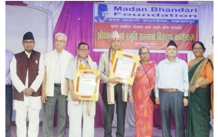
भुजेल र गिरीलाई सम्मानपछि खिचिएको तस्वीर।