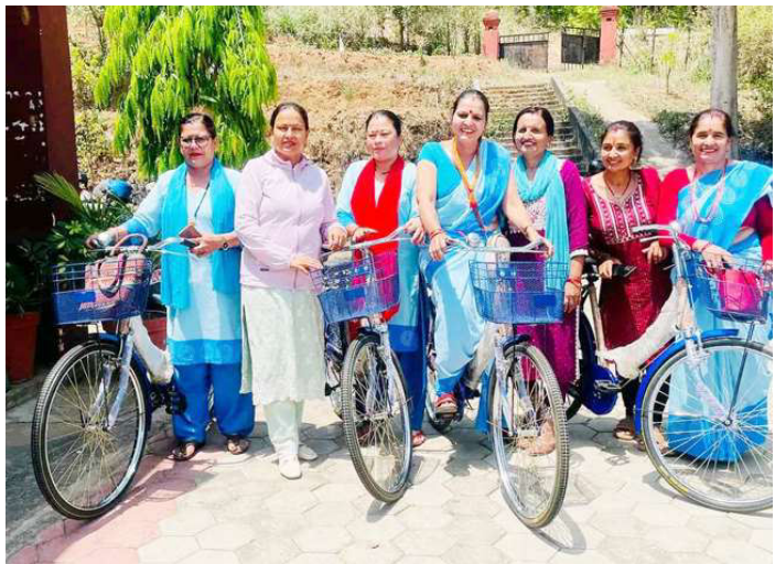
स्वास्थ्य स्वयम्सेविकालाई साइकल हस्तान्तरण गरिँदै।