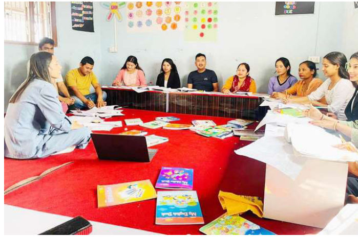
कार्यशालामा सहभागी शिक्षकहरू ।