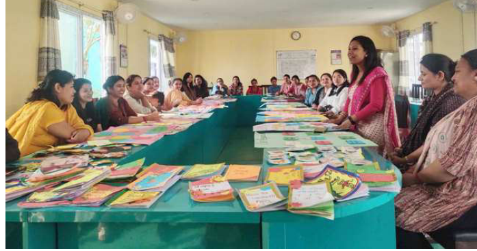
तालिमको समापनमा प्रतिक्रिया व्यक्त गर्नुहुँदै एक शिक्षक।

समाज संवाददाता हेटौडा: गत शनिवार ४ नम्बर वडामा रहेका सामुदायिक र निजी दुवै विद्यालयमा प्रारम्भिक बालबालिका कक्षाका शिक्षकहरूका लागि श्रमिक माविमा आयोजित तीनदिने शैक्षिक सामग्री निर्माण तथा खेलको माध्यमद्वारा सिकाईसम्बन्धी तीनदिने तालिमको समापन कार्यक्रममा सहभागी अधिकांश शिक्षकको प्रतिक्रिया थियो, "हामीलाई तालिम लिनै पुगेको छैन।" सहभागी शिक्षक भन्दै थिए, "हामीलाई तीन दिन सिकेको कुरा पर्याप्त भयो भन्ने लागेको छैन। अझ धेरै सिक्नुपर्छ भन्ने लागेको छ।" नयाँ शैक्षिक सत्रको तयारीस्वरूप वडा कार्यालयले वडामा रहेका सामुदायिक र निजी दुवै विद्यालयका शिक्षकको सहभागितामा भएको तालिममा सहभागी शिक्षकले तालिम पुगेको छैन भन्ने भनाईले दुईवटा पक्षलाई इंगित गर्दछ। पहिलो निजी र सामुदायिक दुवै विद्यालयमा अध्यापनरत शिक्षकहरू विद्यार्थीलाई