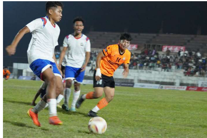
बल अघि बढाउने प्रयास गर्दै मकवानपुरका खेलाडी।