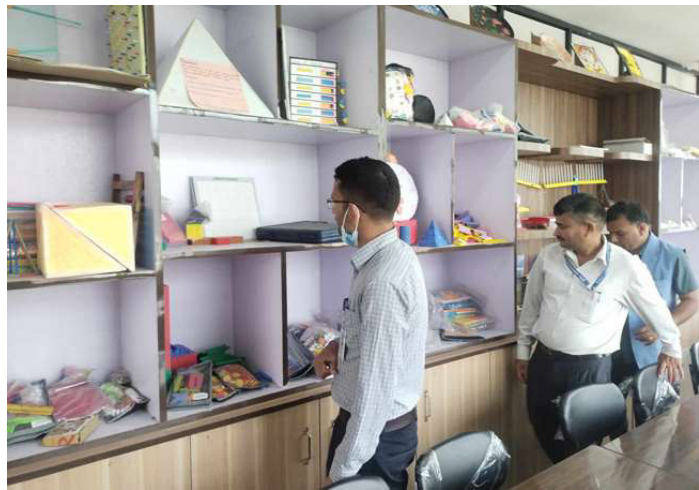
हेटौडा-२ स्थित बालजागृति इंग्लिस सेकेण्डरी स्कूलको प्रयोगशालाको अनुगमन गर्दै ।