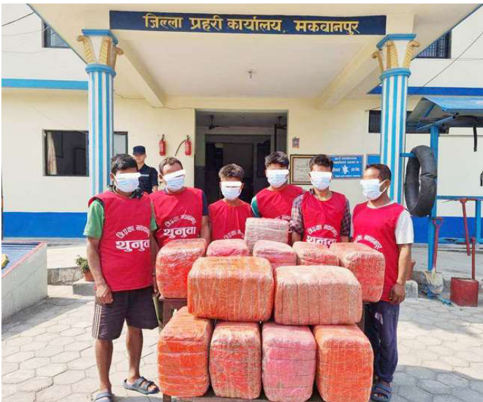
लागुऔषधसहित पक्राउ परेकाहरुलाई प्रहरीले सार्वजनिक गर्दै ।