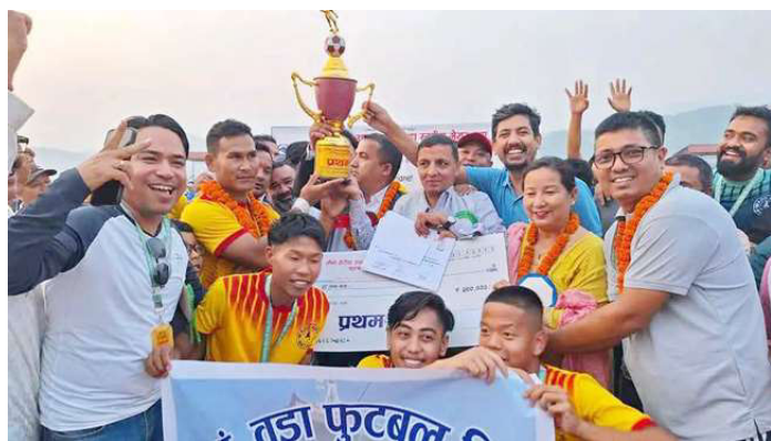
उपाधिसाथ हेटौडा-४ को टिम ।