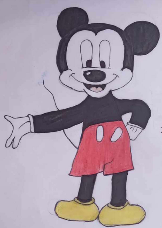
Art by: Mimosha