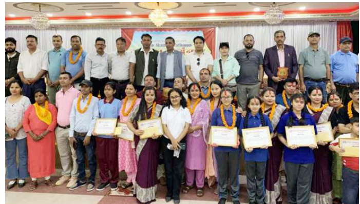
हेटौंडा उपमहानगरपालिका वडा ४ ले आयोजन गरेको अभिभावक विद्यार्थीलाई सम्मान गर्दै ।