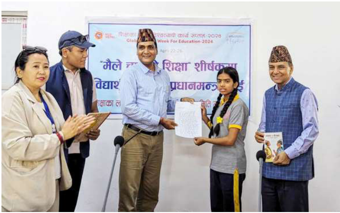
मैले चाहेको शिक्षा विषयमा आधारित भई प्रधानमन्त्रीलाई लेखिएको चिठी मकवानपुरका प्रमुख जिल्ला अधिकारीलाई बुझाउँदै विद्यार्थी ।