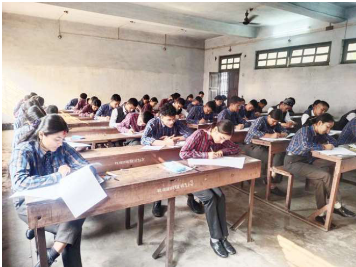
मकवानपुर बहुमुखी क्याम्पसमा कक्षा १२ को वार्षिक परीक्षा दिँदै विद्यार्थी ।