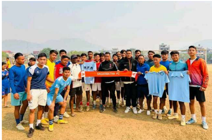
हेटौंडा फुटबल एकेडेमीलाई जर्सी सहयोग गरेपछि सामूहिक तस्वीर खिचाउँदै ।