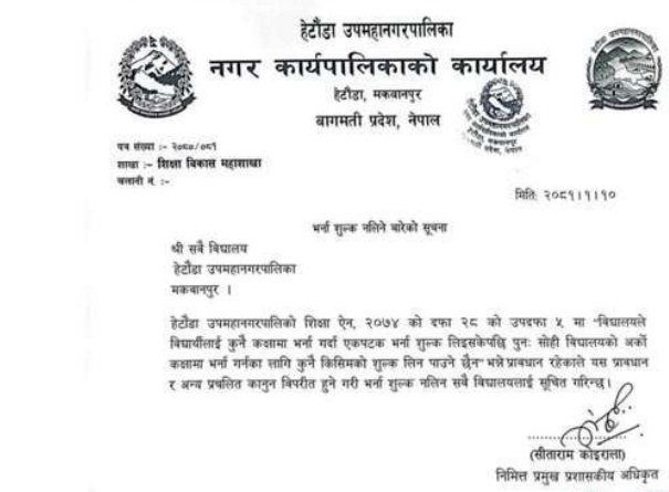
हेटौँडा उपमहानगरपालिकाले मंगलबार जारी गरेको सूचना ।