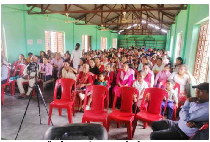
अभिमुखीकरण कार्यक्रममा सहभागी अभिभावकहरु ।

समाज संवाददाता हेटौँडा: हेटौँडा-१२, पदमपोखरीस्थित महेन्द्र माध्यमिक विद्यालयले शैक्षिक सत्र २०८१ को पहिलो दिन अभिभावक अभिमुखीकरण कार्यक्रम गरेको छ । हेटौँडा उपमहानगरपालिकाको शिक्षा विकास महाशाखाको सूचना बमोजिम आइतबार देखि नयाँ शैक्षिक सत्र २०८१ को नियमित पठनपाठन सुरुवातसँगै पहिलो दिन महेन्द्र माविले अभिभावकलाई अभिमुखीकरण गरेको हो । पठनपाठन सुरु गरेकै दिन अभिभावकलाई बोलाएर अधिल्लो शैक्षिक