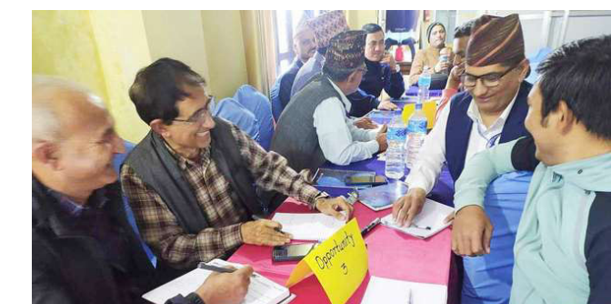
गाउँ शिक्षा योजना गोष्ठीमा सहभागीहरू।