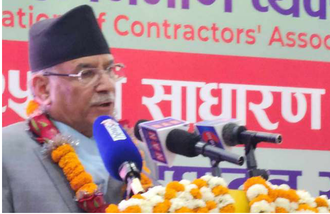
निर्माण व्यवसायी महासंघको साधारणसभालाई सम्बोधन गर्नुहुँदै प्रधानमन्त्री पुष्पकमल दाहाल।

निजी क्षेत्रको सहकार्यलाई आफूले सधैं प्राथमिकतामा राखेकाले पनि अर्थतन्त्रमा केही सुधारको संकेत देखिएको प्रधानमन्त्री दाहालले दाबी गर्नुभयो। एक