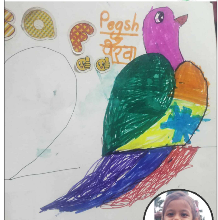
सृष्टी श्रेष्ठ एलकेजी, लिटिल बड्डी प्रि-स्कूल, हेटौँडा-४