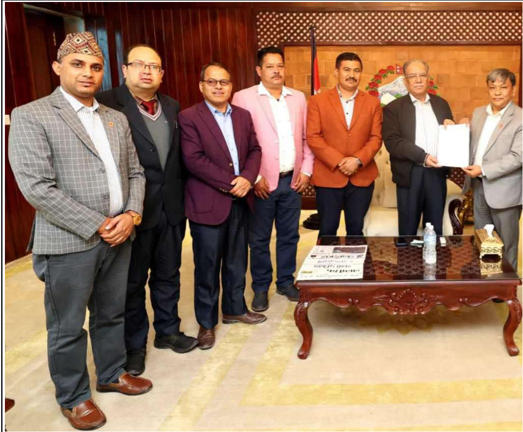
प्रधानमन्त्रीलाई निम्तो: हेटौंडामा हुन लागेको निर्माण व्यवसायी महासंघको साधारणसभामा प्रमुख अतिथिको रूपमा सहभागी भइदिन सोमवार प्रधानमन्त्री पुष्पकमल दहाललाई निम्तो दिँदै महासंघका पदाधिकारीहरु। यही चैत १६ र १७ गते दुईदिन हेटौंडामा महासंघको साधारणसभा हुँदैछ।