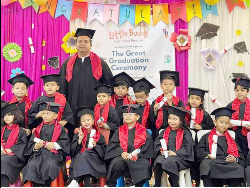
दीक्षात्मक समारोह: हेटौडा-४ स्थित लिटिल बडी प्रि-स्कूलका विद्यार्थीलाई शनिवार दीक्षित गरिंदै। युकेजी तह पूरा गरेका ३३ जना विद्यार्थीलाई दीक्षित गरिएको हो।