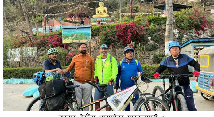
बुधवार हेटौंडा आइपुगेका साईकलयात्री।