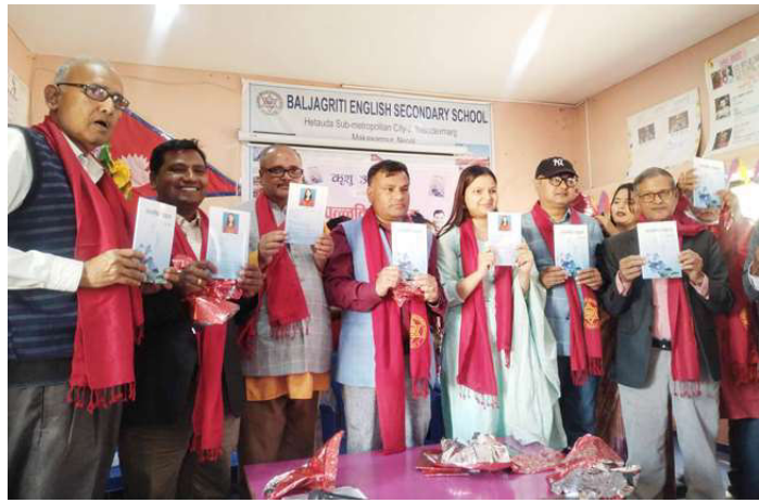
“पल्लवित पाइला” विमोचन गरिदै ।