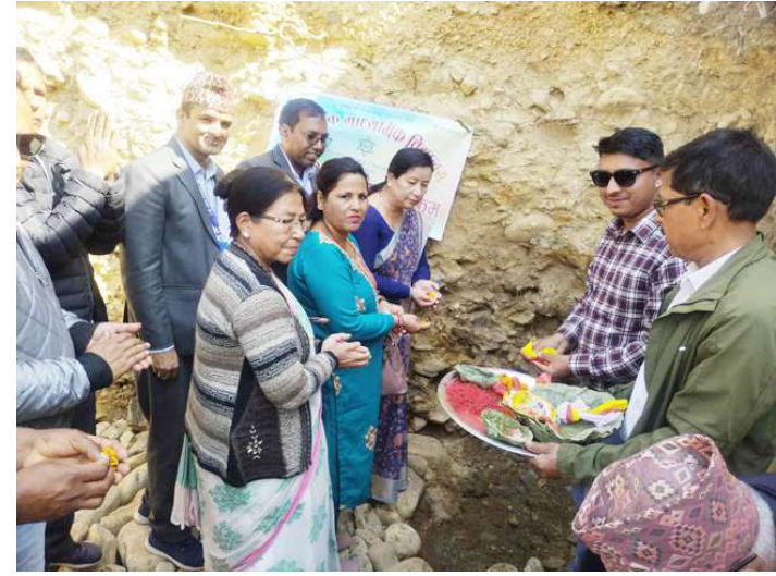
भवन सिलान्यास गर्नुहुँदै नगरप्रमुख लामा ।