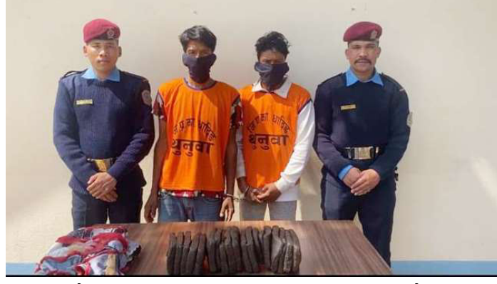
लागुऔषध चरेससहित पक्राउ परेका दुईजनालाई सार्वजनिक गर्दै प्रहरी। समाज संवाददाता हेटौंडा: लागुऔषध चरेससहित थाहाका दुई जना पक्राउ परेका छन्। पक्राउ पर्नेमा थाहा नगरपालिका-८ स्थित

समयमा धादिङ जिल्लाको थाक्ने गाउँपालिका-२ महादेववेशीस्थित आषा मनहरी सडकखण्डमा प्रहरी चौकी महादेववेशी धादिङबाट खटिएको प्रहरी टोलीले सवारी साधन सुरक्षाजाँच गर्ने क्रममा मकवानपुरबाट महादेववेशीतर्फ जाँदै गरेको ना ४ ख ४८३ नम्बरको यात्रु वाहक बसमा सवार दुई जनालाई प्रहरीले लागुऔषधसहित पक्राउ गरेको हो। कपडाभित्र लुकाएको अवस्थामा उनीहरूको साथबाट प्रहरीले १९ वटा पाकेटमा ९ केजी ५ सय ग्राम चरेस फेला पारी बरामद गरेको थियो। पक्राउ परेका दुई जनालाई मंगलबार जिल्ला अदालत धादिङमा उपस्थित गराएर ६ दिनको म्याद थपि अनुसन्धान गरिरहेको जनाएको छ।