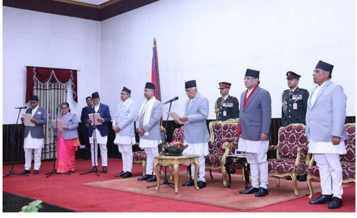
शपथ ग्रहण गर्दै नवनियुक्त प्रदेश प्रमुखहरू। काठमाडौं: नवनियुक्त तीन प्रदेश प्रमुखले पद तथा गोपनीयताको शपथ लिएका छन्। गत सोमवार बसेको