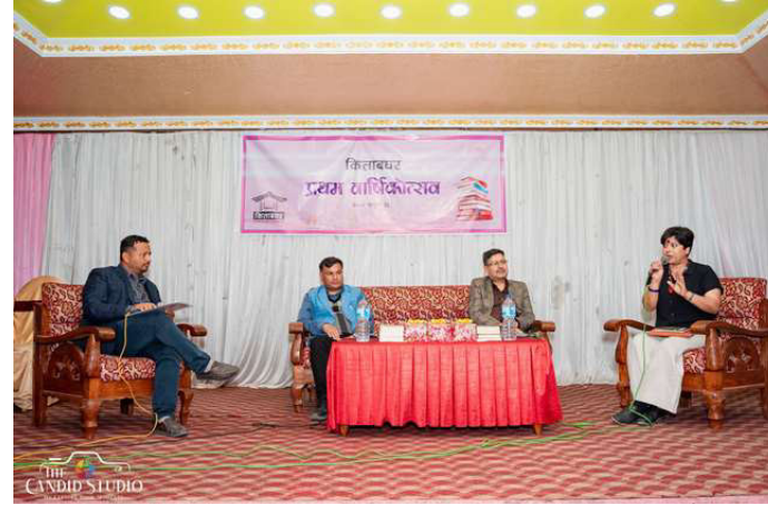
पठन संस्कृतिबारे बहसमा सहभागीहरु।