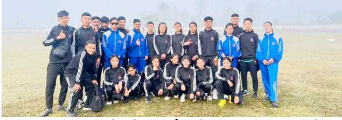
प्रदेशस्तरीय राष्ट्रपति रनिड शिल्डमा दौडतर्फ तृतीय हुने मकवानपुरको टिम