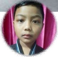
अनुशन्स श्रेष्ठ नवोदय शिशु सदन, कक्षा -२