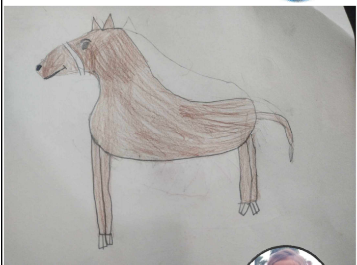
सृष्टी श्रेष्ठ एलकेजी, लिटिल बट्टी प्रि-स्कूल, हेटौडा-४