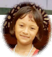
समृद्धि श्रेष्ठ कक्षा-२, ब्रह्मदिक एकोडेमी, हेटौडा-४