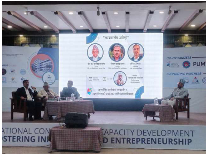
नवप्रवर्तन र उद्यमशीलताको विकासमा "सरकारसँग अपेक्षा" बहसमा सहभागी।