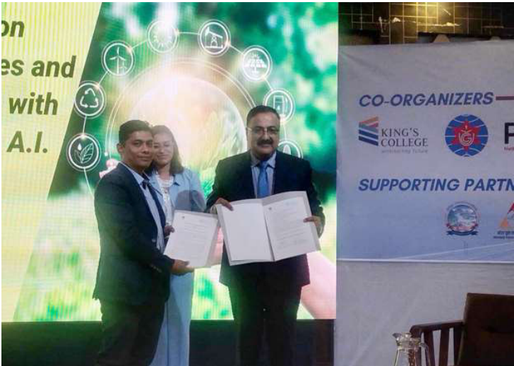
भारतीय शैक्षिक संस्था र म्यानेजमेन्टबीचको सम्भौतापत्र आदानप्रदान गरिँदै।