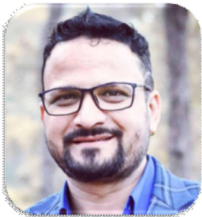
रिमल दिग्जा सामाजिक सञ्जाल

एक्काइसौं शताब्दीले सुचना प्रविधिलाई विकसित बनाएको छ। भन्दा दुइत नहोला । सुचना प्रविधिको विकास संगै इन्टरनेट, इमेल वलडवाइड वेवको व्यापकता बढेको छ । नेपालमा पनि इन्टरनेटको प्रयोग गर्ने जनसंख्या १८ प्रतिशत भन्दा माथि पुगिसकेको छ । आगामी दिनहरूमा यसको प्रयोग बढ्दै गएको छ । वर्तमान विश्वमा दुई किसिमको सभ्यता, भर्चुअल र भौतिक सभ्यताको सुरुवात भइसकेको छ । आउने केही दशक भित्रै संसारको जनसंख्या भन्दा दुई तीन गुणा बढी प्रयोगकर्ता, जनसंख्या इन्टरनेटमा देखा पर्नेछ । वास्तवमा बदलिँदो परिवेशसँगै इन्टरनेट एउटा यस्तो प्रविधिको रूपमा हाम्रो सामुन्ने आएको छ जो उपयोगको लागि सबैलाई उपलब्ध छ र सर्वहितमा छ । इन्टरनेटको माध्यमद्वारा कम्प्युटर वा मोबाइलमा इन्टरनेटको प्रयोग गरी आफुले प्राप्त गरेका सिर्जना, विचार, डिजिटल फोटो, भिडियो, प्रत्यक्ष कुराकानी, सुचना आदान प्रदान सहज छिटो छरितो माध्यम बन्न पुगेकोले र यो समुदायमा आधारित सामाजिक आदान प्रदान गर्ने सञ्चार साधनको रूपमा यसलाई धेरै भन्दा धेरैले प्रयोगगर्ने भएकोले यसलाई सामाजिक सञ्जाल भनिएको हो । सामाजिक सञ्जालका च्यानलहरू प्रायः निःशुल्क हुन्छन् । फेसबुक, युट्युब, भाइवर, ट्वीटर, ह्वाट्सअप, म्यासेन्जर, टिकटक आदि यसका उदाहरण हुन् । यो खासगरी कम्प्युटर वा स्मार्टफोन जस्ता उपकरणमा इन्टरनेट जडान गरी प्रयोग गर्ने गरिन्छ । यसको प्रयोगको दायरा धेरै फराकिलो छ । हरेक व्यक्तिले हरेक क्षेत्रमा प्रयोग गर्न सकिने सरल प्रविधि भएकोले यो अहिले मानिसहरूको अभिन्नअंग जस्तै बन्दै गएको छ । हाल विश्व तथ्यांक अनुसार एक व्यक्तिले दिनको २० देखि २५ प्रतिशत समय इन्टरनेटमा बिताउने गरेको तथ्यांक बाहिरिएको छ । सामाजिक सञ्जाललाई एकअर्काको