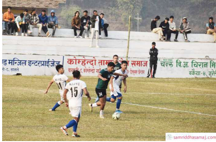
विहिवारको खेलमा बल अगाडि बढाउँदै एनआरटीका खेलाडी ।