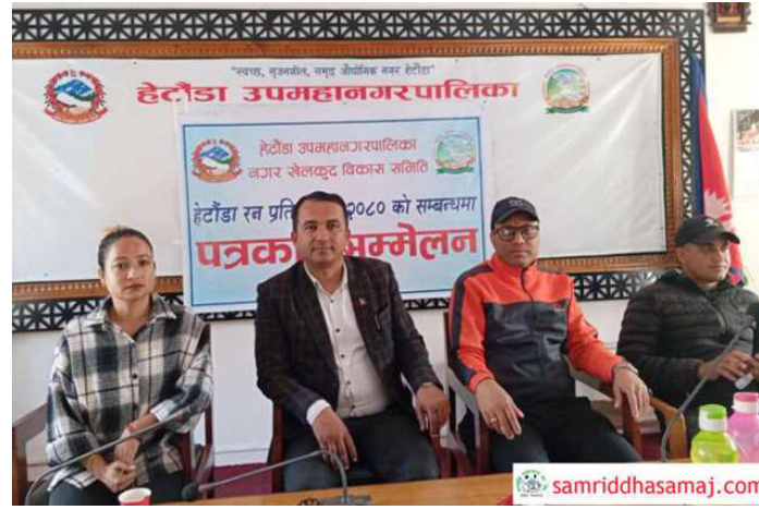
हेटौँडा रन बारे पत्रकार सम्मेलन गरेर जानकारी गराउँदै।

समाज संवाददाता हेटौँडा: आउँदो शुक्रबार हेटौँडामा खुल्ला राष्ट्रिय पुरुष हेटौँडा रन प्रतियोगिता हुने भएको छ। यसअघि जिल्लास्तरीय दौडको रूपमा आयोजना गरिएको हेटौँडा रनलाई यो वर्ष खुला गरिएको छ। नगर खेलकुद विकास समितिको आयोजना तथा हेटौँडा उपमहानगरपालिकाको आर्थिक सहयोगमा प्रतियोगिता हुन लागेको हो। यस वर्ष पुरस्कार राशी बढाइएको छ। प्रतियोगितामा ५ किलोमिटरको दूरी पार गरेर प्रथम हुने खेलाडीले ६० हजार