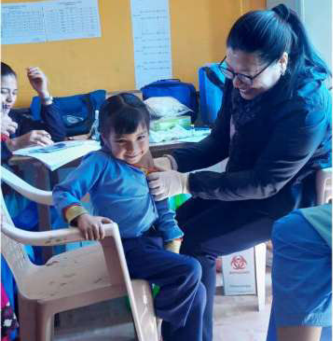
हेटौँडा-५, गर्दोस्थित लक्ष्मी आधारभूत विद्यालयमा खोप लगाउँदै स्वास्थ्यकर्मी।

समाज संवाददाता छ। राष्ट्रिय कार्यक्रमको रूपमा खोप कार्यक्रम सुरु भएको हो। खोप अभियानअन्तर्गत जिल्ला स्वास्थ्य कार्यालय