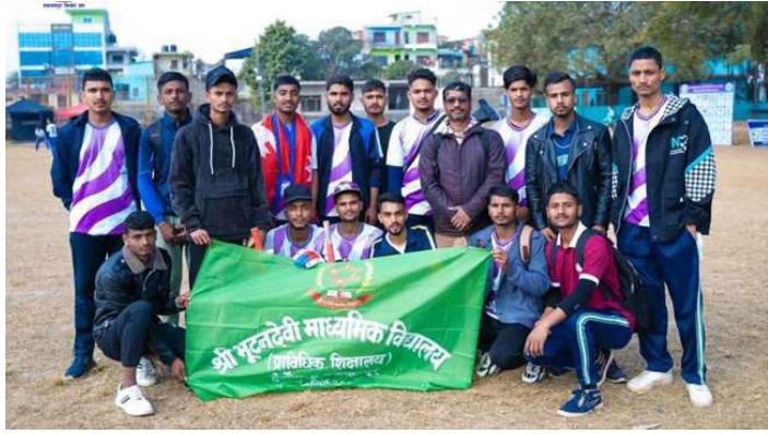
विद्यालय स्तरीय क्रिकेट प्रतियोगिताको पहिलो खेलामा विजयी टीम भूटनदेवी माविका विद्यार्थीहरू ।