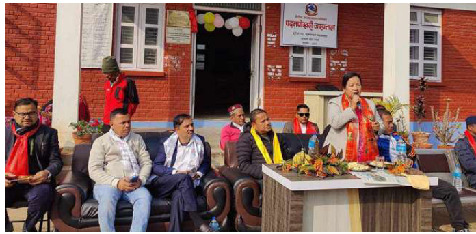
केही समयअघि पदमपोखरी अस्पतालको उद्घाटन कार्यक्रममा सहभागी।