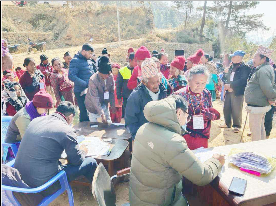
वडाै सामाजिक सुरक्षा भत्ता: मकवानपुर जिल्लाको इन्द्रसरोवर गाउँपालिका-१, मार्खुमा बुधवार ज्येष्ठ नागरिकलाई सामाजिक सुरक्षा भत्ता वितरण गरिँदै। गाउँपालिकाले वडा र बैकसँग समन्वय गरेर सामाजिक सुरक्षा भत्ता वितरण गरेको हो। वडामै सामाजिक सुरक्षा भत्ता वितरण हुँदा ज्येष्ठ नागरिकलाई सहजता भएको छ।