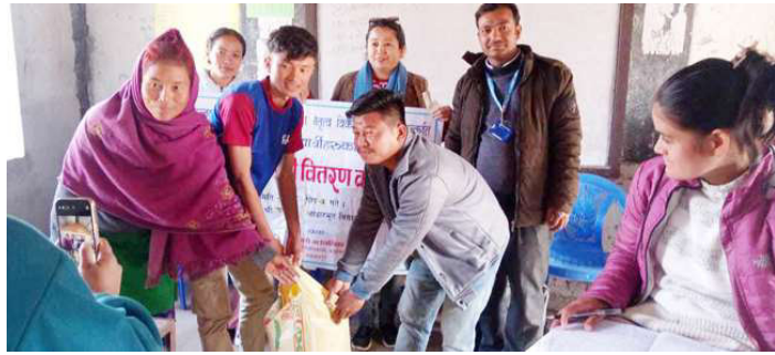
विद्यार्थीलाई खाद्यान्न वितरण गरिँदै