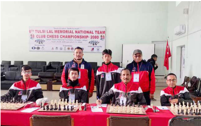
तुल्सीलाल स्मृति बुद्धिचाल प्रतियोगिताको सेमिफाइनलमा प्रवेश गर्ने मकवानपुरका टिम।