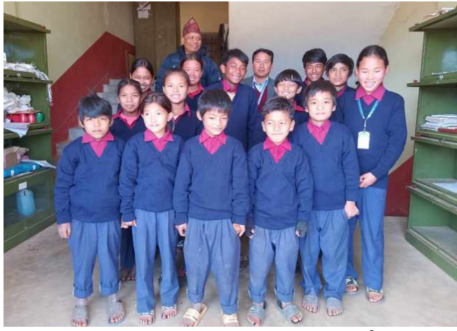
न्यानो कपडा वितरणपछि सामूहिक तस्वीर खिचाउँदै ।