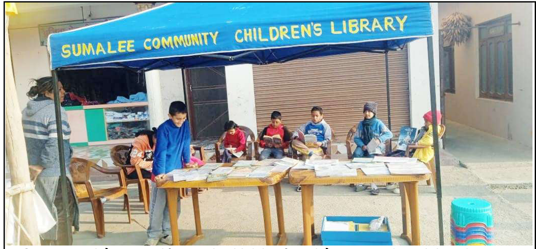
धुमती पुस्तकालय: हेटौँडा-८, कमानेस्थित कमाने एकेडेमीको शनिबार हेटौँडा-७, नागस्वतीमा राखेको धुमती पुस्तकालय। विद्यालयले बालबालिका लक्षित गरेर हरेक शनिबार हेटौँडा-८ र हेटौँडा-७ का विभिन्न स्थानमा धुमती पुस्तकालय सेवा प्रदान गर्दै आएको छ। धुमती पुस्तकालयले बालबालिकामा पठन संस्कृतिको विकास हुने अपेक्षा विद्यालयको छ।