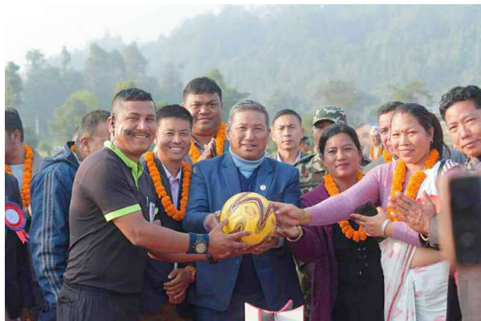
रेप्रीलाई बल हस्तान्तरण गरी प्रतियोगिताको उद्घाटन गरिदै ।