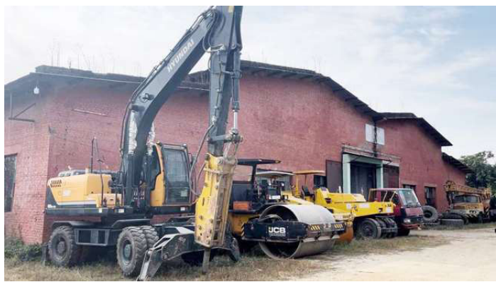
हेभी इक्वूपमेन्ट डिभिजन हेटौंडामा पार्कीड अवस्थामा रहेको इक्वूपमेन्टहरू ।