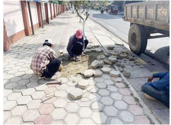
सडकपेटी मर्मत गर्दै मजदुरहरू ।