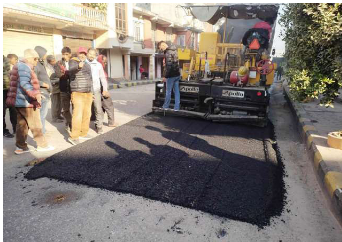
मंगलबार बिहान हेटौँडा-४, शितलमहलचोकबाट पारिजातपथमा कालोपत्रे गर्न सुरु गरिँदै।