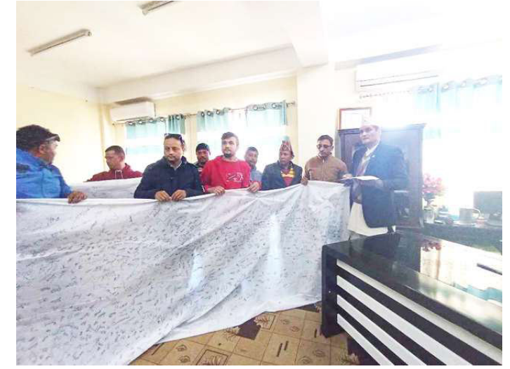
बालकुमारी घटनालाई लिएर ध्यानाकर्षणपत्र र संकलित हस्ताक्षर मकवानपुरका प्रमुख जिल्ला अधिकारीमाफत प्रधानमन्त्री कार्यालयमा पठाउँदै।