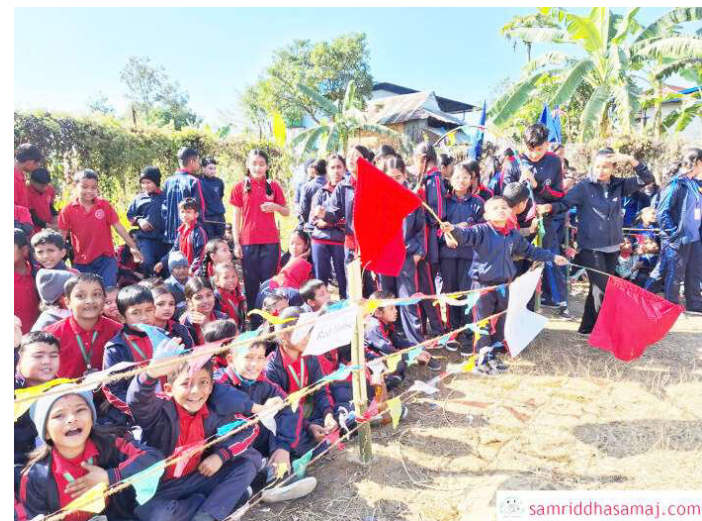
खेलकुद कार्यक्रममा रमाउँदै विद्यार्थी।