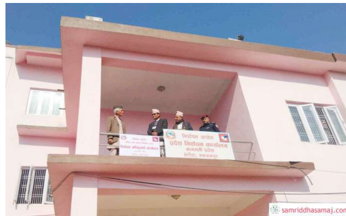
राष्ट्रिय सभा सदस्य निर्वाचनका लागि स्थापना गरिएको कार्यालयको बोर्ड अनावरणपछि खिचिएको तस्वीर ।