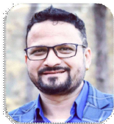
विज्ञान रिमाल 'दिगमज'

राष्ट्रिय पोशाक टोपी दिवसको ११औं वर्ष नेपाली पोशाक, पहिरन र पहिचानको निर्मित अन्तर्राष्ट्रियस्तरमा नेपालीहरूको राष्ट्रिय पोशाक लोप हुने अवस्थामा पुगेको भन्दै अभियानका रूपमा संचालन गर्दै मनाउँदै आइरहेको नेपालीहरूले आफ्नै पहिरन नेपाली टोपी शिरमा लगाएर मनाउन सकिने दिवसको रूपमा मनाउ ।