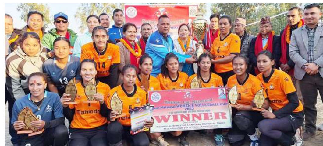
एपीएफलाई राष्ट्रिय महिला भलिबल प्रतियोगिताको उपाधि हस्तान्तरण गरिँदै ।