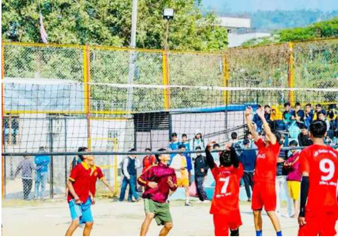
राष्ट्रपति रनिङशिल्ड अन्तर्गत भलिबल प्रतियोगिताको दृश्य।

विद्यालय प्रथम, भुकुटी माध्यमिक विद्यालय द्वितीय र चन्द्रोदय माध्यमिक विद्यालय तृतीय भएका छन्। पुरुषतर्फको कबड्डी प्रतियोगितामा जनप्रिय माध्यमिक विद्यालय प्रथम, प्रगति माध्यमिक विद्यालय द्वितीय र चन्द्रोदय माध्यमिक विद्यालय