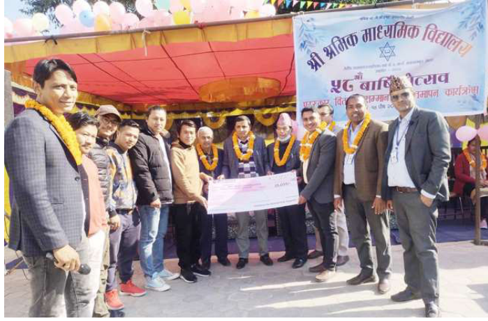
सहयोग रकमको नमूना चेक हस्तान्तरण गरिँदै ।