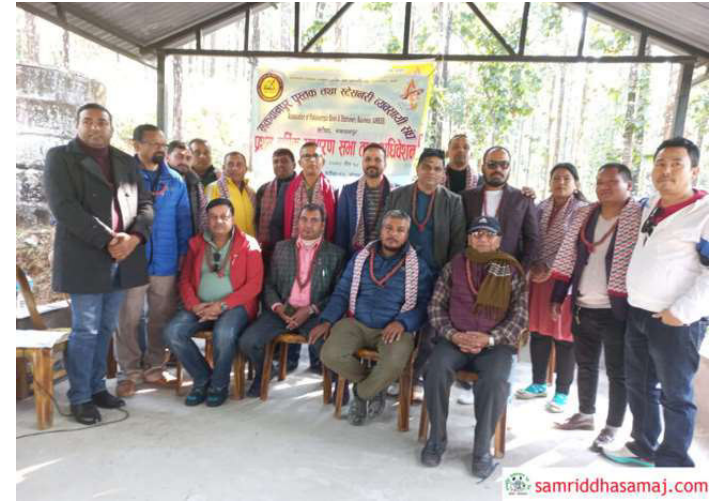
नयाँ समिति चयनपछि खिचिएको सामूहिक तस्वीर ।