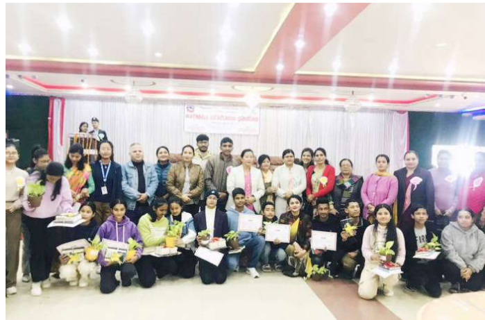
पुरस्कार वितरणपछि सामूहिक तस्वीर खिचिँदै ।