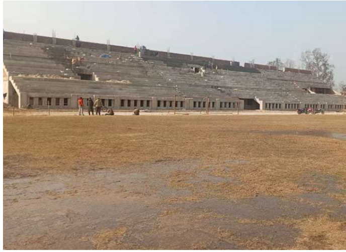
छैठौं संस्करणको मकवानपुर गोल्ड प्रतियोगिताको लागि गौरीटार रंगशालालाई व्यवस्थापन गरिँदै ।