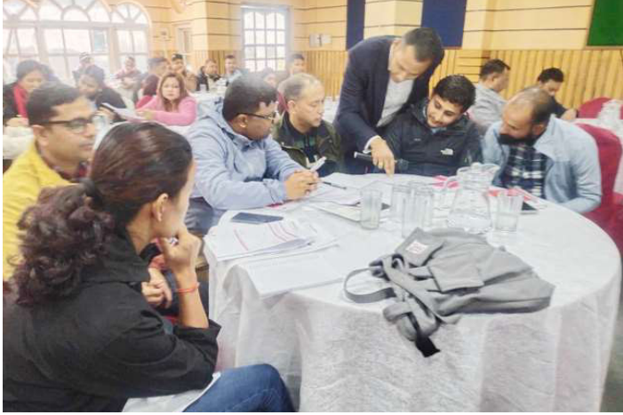
शिक्षालाई पुनः परिकल्पना गर्न आयोजित कार्यशालामा सहभागी ।