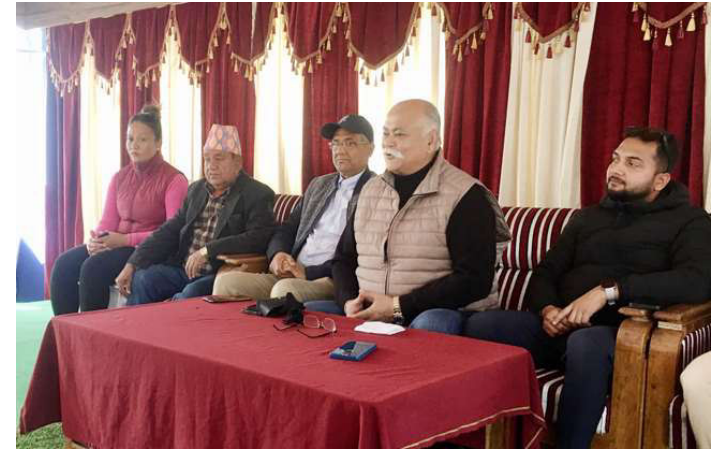
पूर्वराजा हेटौँडा आउने विषयमा जानकारी दिन आयोजित पत्रकार सम्मेलनमा सहभागी राप्रपाका नेताहरू।