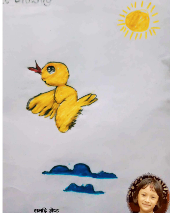
समृद्धि श्रेष्ठ कक्षा-२, ब्रम्हदिक एकेडेमी, हेटौँडा-४