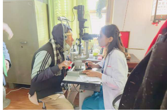
आँखा केन्द्र स्थापनापछि सामूहिक तस्वीर खिचाउँदै।