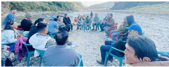
विद्यालयलाई सहयोग गर्ने विषयमा पूर्वविद्यार्थीबीच भइरहेको छलफल ।