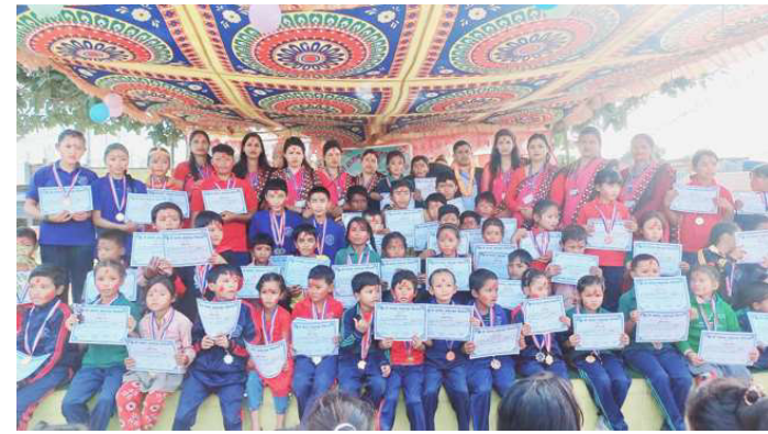
वार्षिकोत्सवको अवसरमा सम्मानित विद्यार्थी, शिक्षकको सामूहिक तस्वीर।