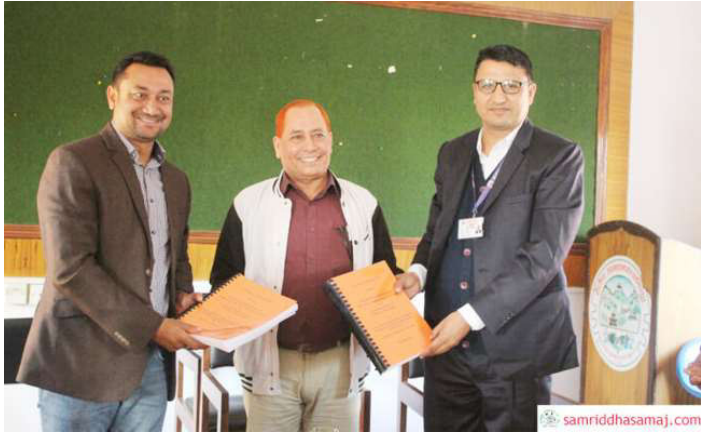
हेटौँडा भ्यु टावर निर्माणसम्बन्धी सम्झौता गरी सम्झौतापत्र आदानप्रदान गरिँदै । फाइल तस्वीर ।