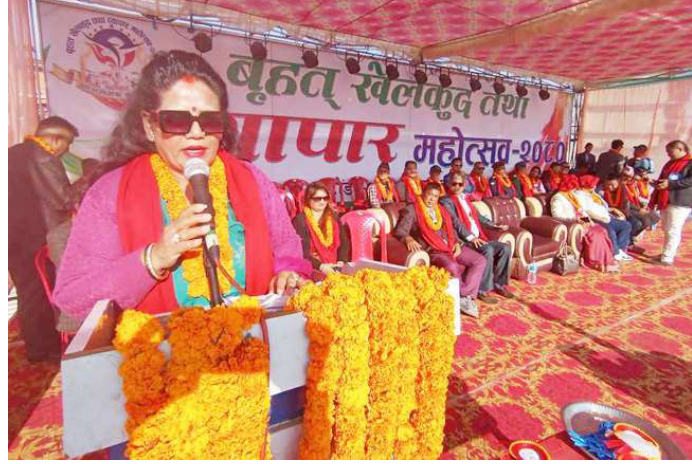
खेलकुद तथा व्यापार महोत्सवको उद्घाटन कार्यक्रमलाई सम्बोधन गर्नुहुँदै मन्त्री खड्का।